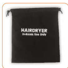
Sacchetto porta phon (opzionale)