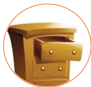
Modello da Cassetto