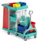
Magic Line 370B