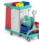
Magic Line 370S