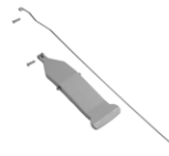
Kit pedale per portasacco Magic